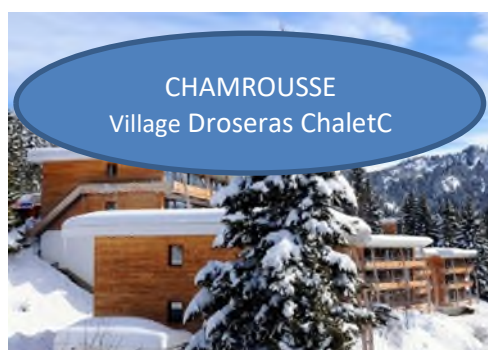
CHAMROUSSE Village Droseras ChaletC