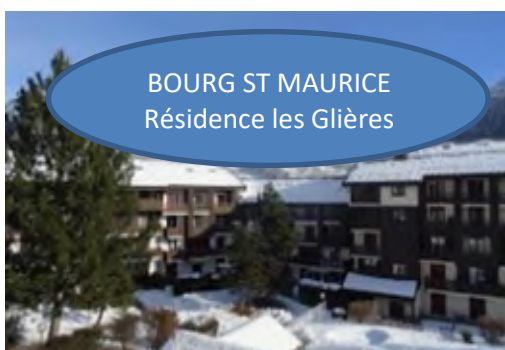
BOURG ST MAURICE Résidence les Glières

& corinne.espinosa-trombetta@totalenergies.com